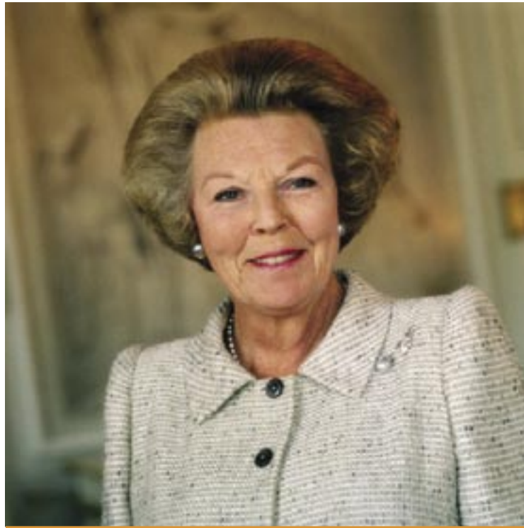
La reina Beatrix, un ejemplo de libertad en Holanda

En Canadá, la princesa Beatrix asistió al jardín de infantes y a la escuela primaria. Cuando regresó a los Países Bajos, continuó su educación primaria en The Workshop (De Werkplaats) y en la Kees Boeke's Progressive School , de Bilthoven. En abril de 1950, la princesa Beatrix se inscribió en la Universidad de Leiden. A su vez, fue una discípula activa de la Asociación de Mujeres Estudiantes de esa universidad. En sus primeros años allí, cursó estudios en sociología, jurisprudencia, economía, historia parlamentaria y leyes constitucionales. Con una avidez educativa sin límites, también asistió