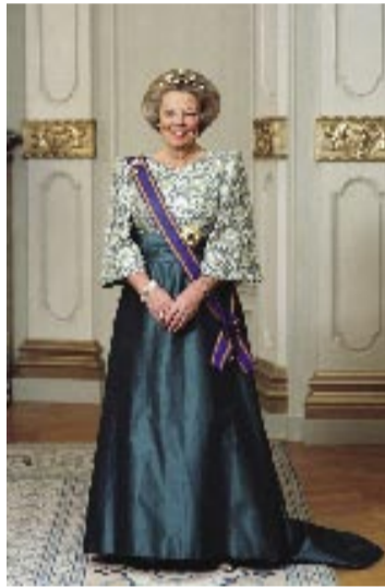
Una visita ilustre

ración argentino-holandesa no sólo alcanza sus mayores valores en cuestiones diplomáticas, culturales y económicas, sino también en derechos humanos y militancia por la paz mundial.