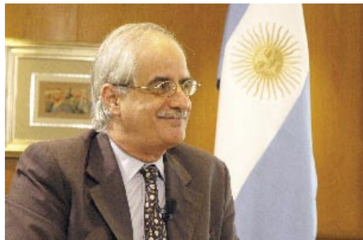
El ministro Jorge Enrique Taiana

En el ámbito económico y comercial, los vínculos entre ambos países