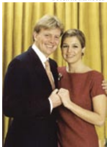
Príncipe de Orange Guillermo Alejandro y la Princesa Máxima Zorreguieta

Jorge Enrique Taiana, Ministro de relaciones exteriores, comercio internacional y culto.